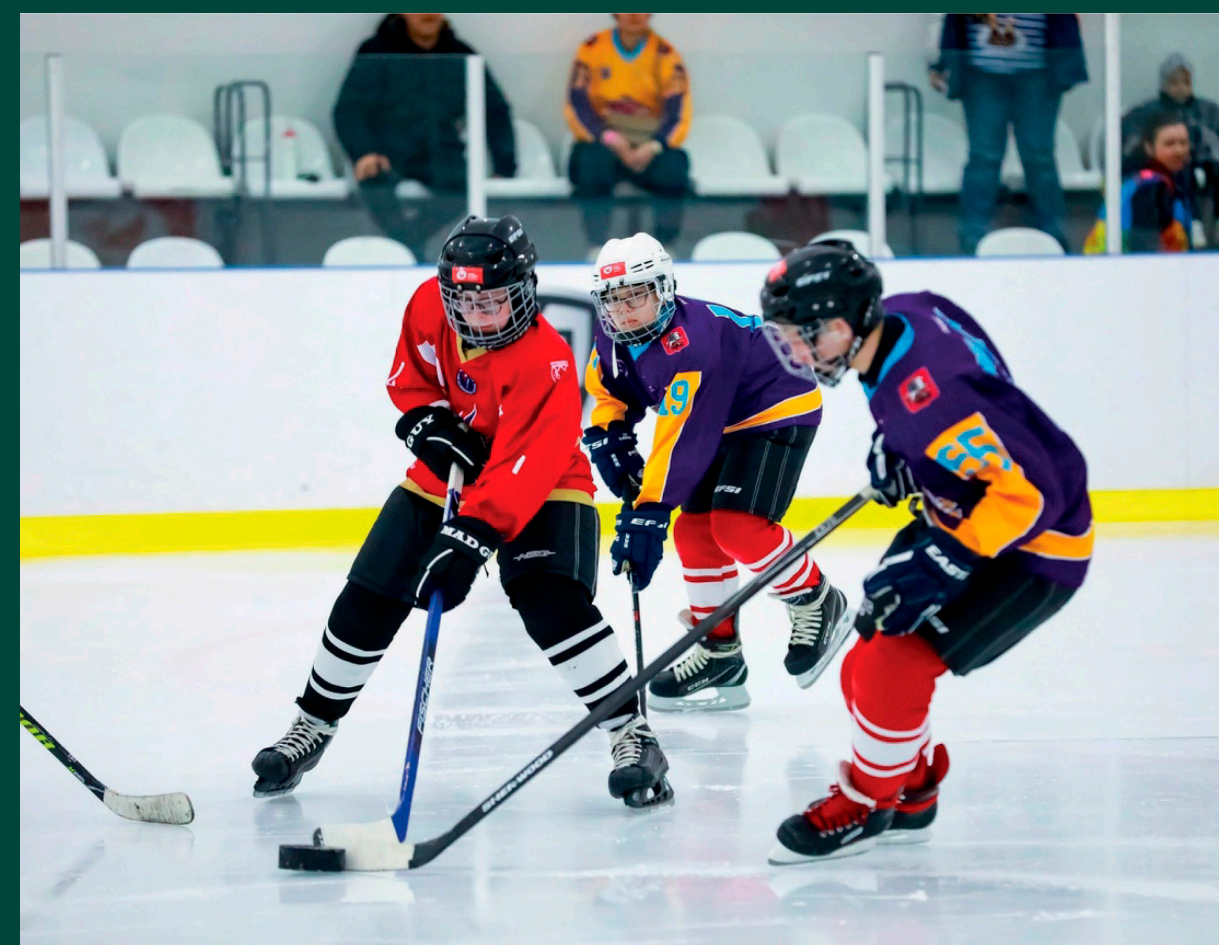
02 Хоккей для слабовидящих