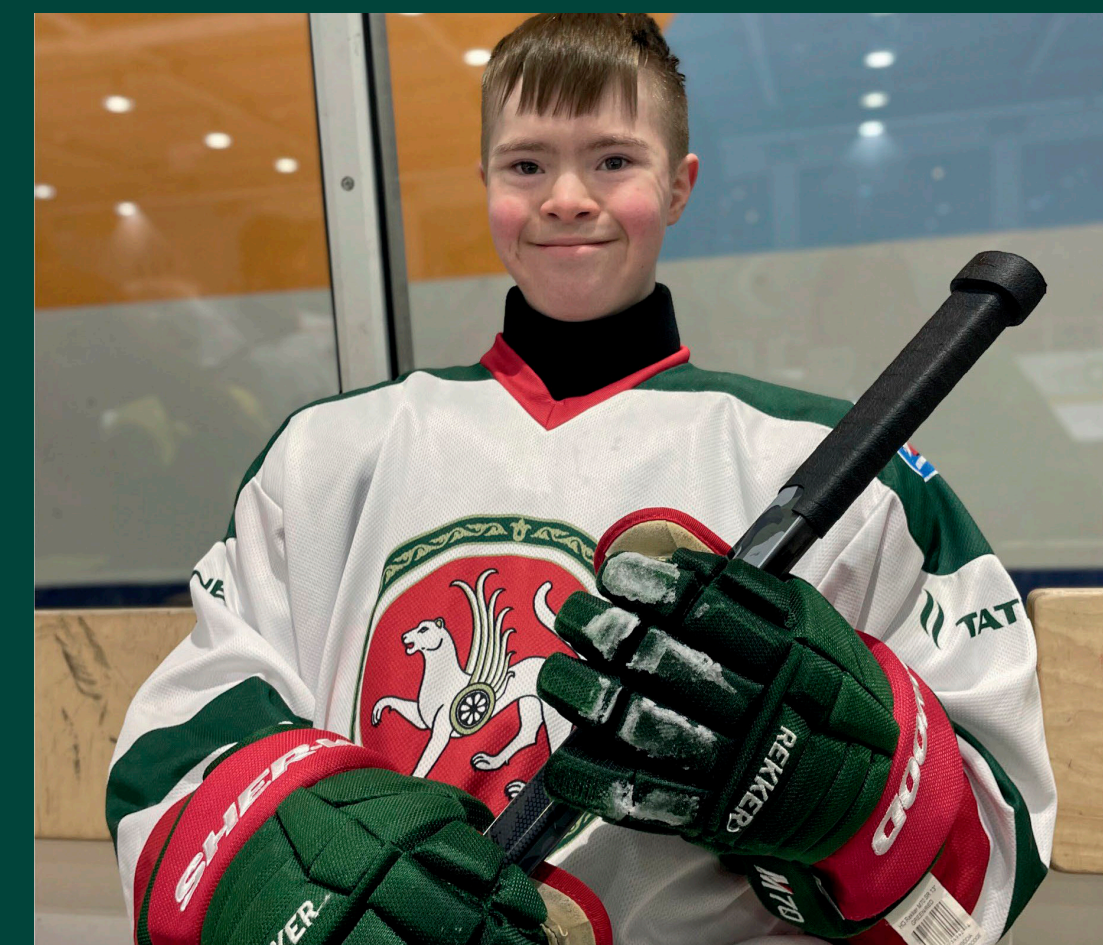
03 Специальный хоккей